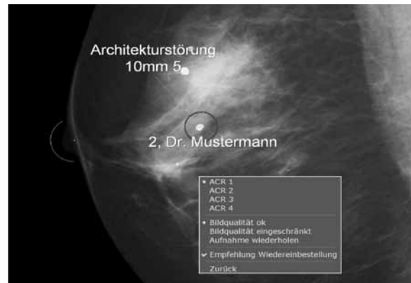
Direkte Befundeingabe im Bild

Die einzigartige Pyramidenkompression ermöglicht ein verzögerungsfreies Arbeiten mit allen verfügbaren Daten. Komplexe Bildserien können binnen weniger Sekunden angezeigt werden. Durch die asynchrone Übermittlung der erfassten Bilder an das Screening-Archiv sowie den sicheren, verschlüsselten Transport über das Internet (optional) kann MammoView äußerst flexibel eingesetzt werden (z. B. MammaMobil).